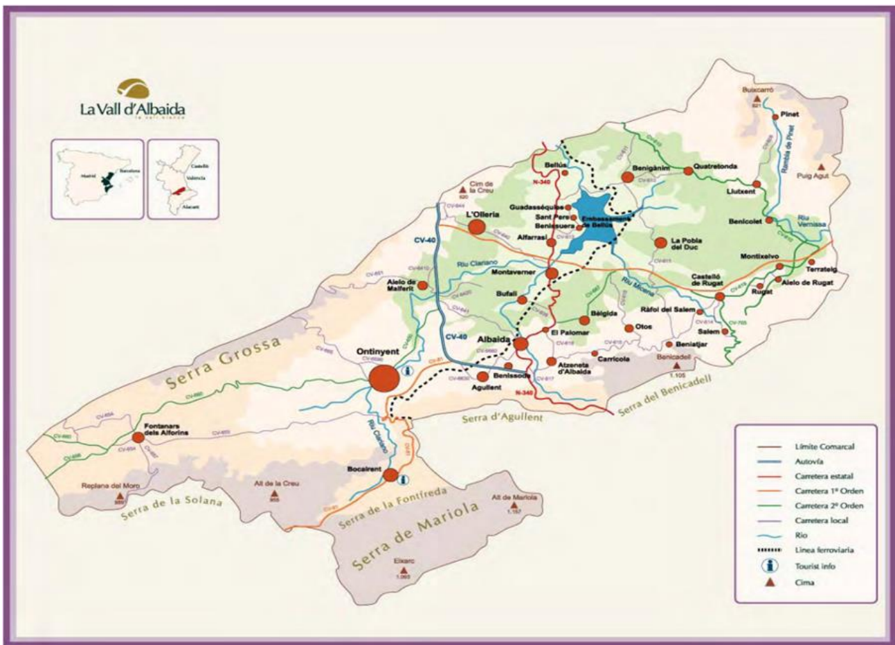
Font: Mancomunitat de Municipis de la Vall d'Albaida